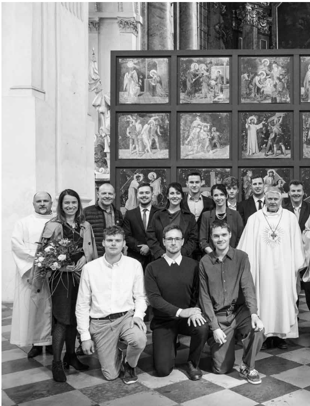
Břmování s biskupem Mons. Václavem Malým 14. dubna 2024 aneb „vrh pětadvaceti“