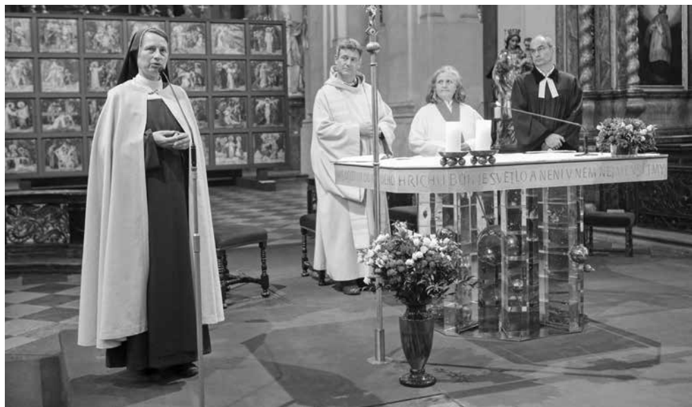
Z Ekumenické modlitby ke Dni Země.