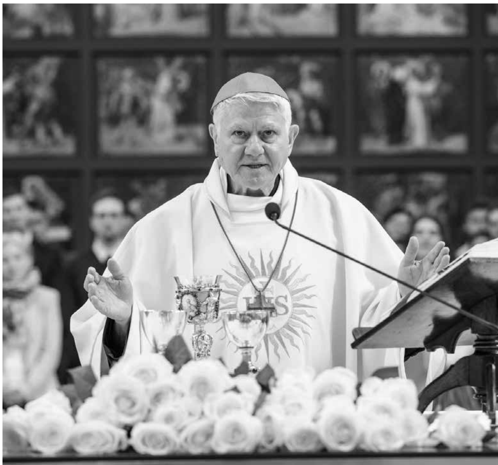
Biskup Mons. Václav Malý při biřmování 14. dubna 2024.